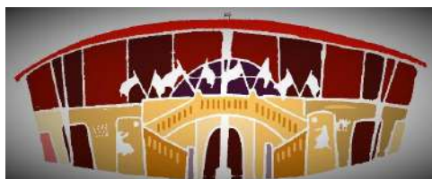
Pomarez Arènes Traditions